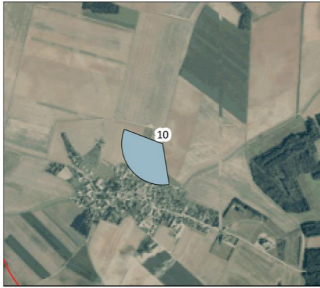
Source : IGN BD ORTHO Réalisation AEPE-Gingko 2022 Situation des abords du point de vue