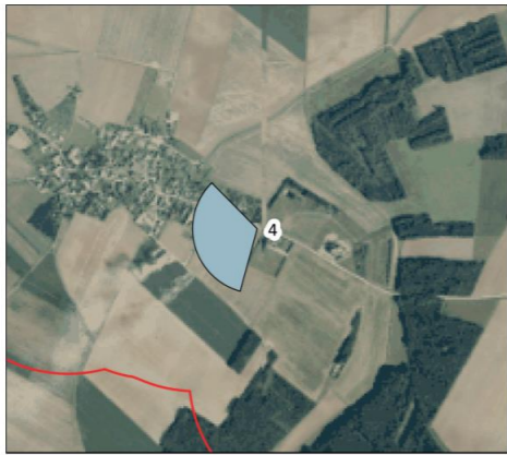
Situation des abords du point de vue